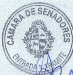
Germán Coutinho Senador de la República

Sin otro particular, saluda a usted muy atentamente